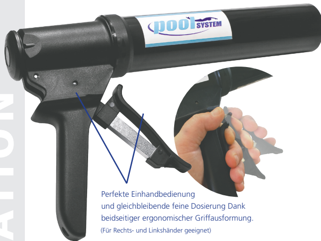
Perfekte Einhandbedienung und gleichbleibende feine Dosierung Dank beidseitiger ergonomischer Griffausformung. (Für Rechts- und Linkshänder geeignet)