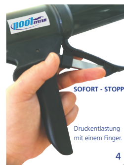
SOFORT - STOPP Druckentlastung mit einem Finger.

Entwicklungsergebnis aus jahrzehntelanger Erfahrung als Systementwickler für die Dichtstoffindustrie und dem Dialog mit den Verarbeitern.